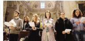
Alcuni dei trenta catecumeni che ricevono i sacramenti.

chile differenti, rappresentate dai parroci che hanno consacrato la Messa. Alberto di Valpurga, Renato Sopra, Calisto, Dalmiro, Lello, Lotino, Marco, Montello, Ponte San Pietro, Riva, San Giovanni, Sello Basilio, Suisi, Torni Boldone, Verdellino; in città le parrocchie di Loreto, Sant'Assandro della Cattedrale, San Paolo, San Pio