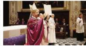
Il vescovo Francesco Beschi durante la celebrazione.

I catecumeni erano accompagnati dai loro padri, che hanno portato la mano destra sulla loro spalla per testimoniare, insieme ai catechisti, dal percorso compiuto con la candidatura. Provenivano da 19 parrocchie